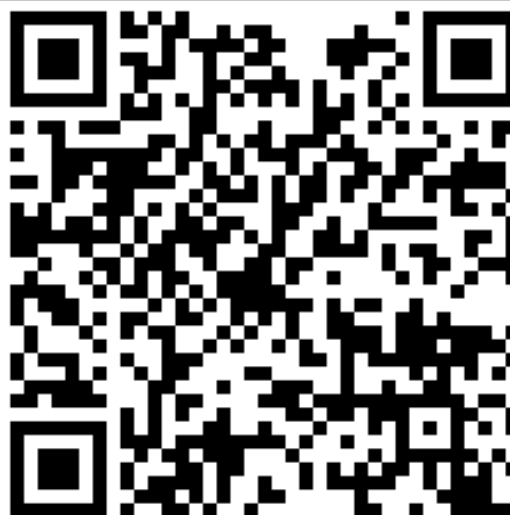
QR code evento PLS

Diventa socio WWF Viene a trovarci il 1° e 3° lunedì del mese presso la nostra sede di Via Corsica 27 a Livorno